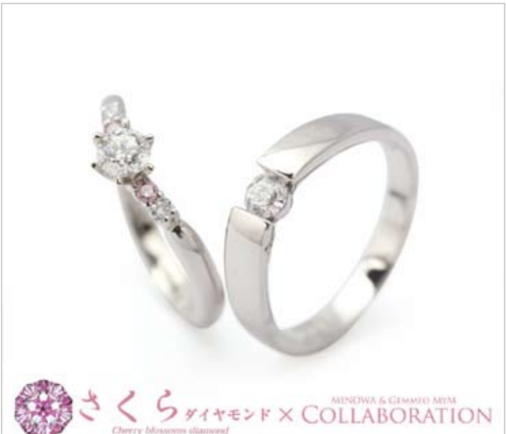
「さくらダイヤモンド」。桜の花のように見えるようカットされた、まさに芸術品とも言えるダイヤモンドを使用。87面体という驚異的な美しさを実感しよう。