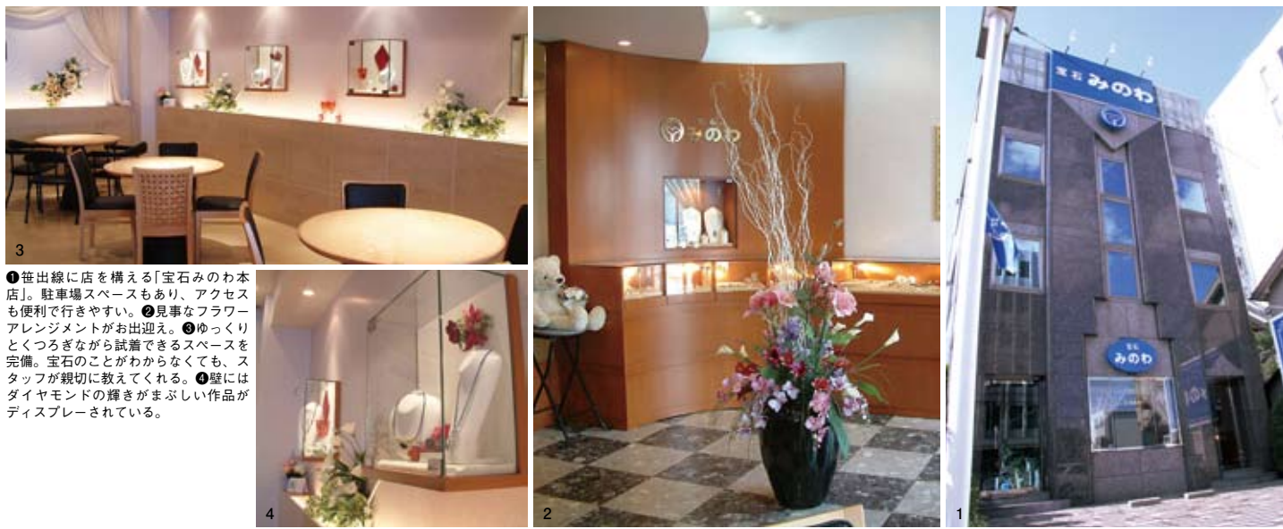
● 世出線に店を構える「宝石みのわ本店」。駐車場スペースもあり、アクセスも便利で行きやすい。● 見事なフラワーアレンジメントがお出迎え。● ゆっくりとくつろぎながら試着できるスペースを完備。宝石のことがわからなくても、スタッフが親切に教えてくれる。● 壁にはダイヤモンドの輝きがまぶしい作品がディスプレイされている。