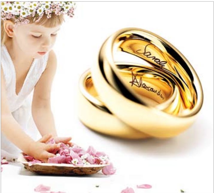
「マイスター」。長く着けるリングだからこそ「着け心地」にこだわりたい。お店で試着して、滑らかさを体験しよう。