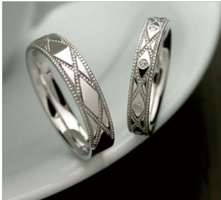
「コラニー」。購入後もダイヤモンドの数を増やしたり、リングの色を変えることもできる。ふたりと一緒に歩み続けるリング。