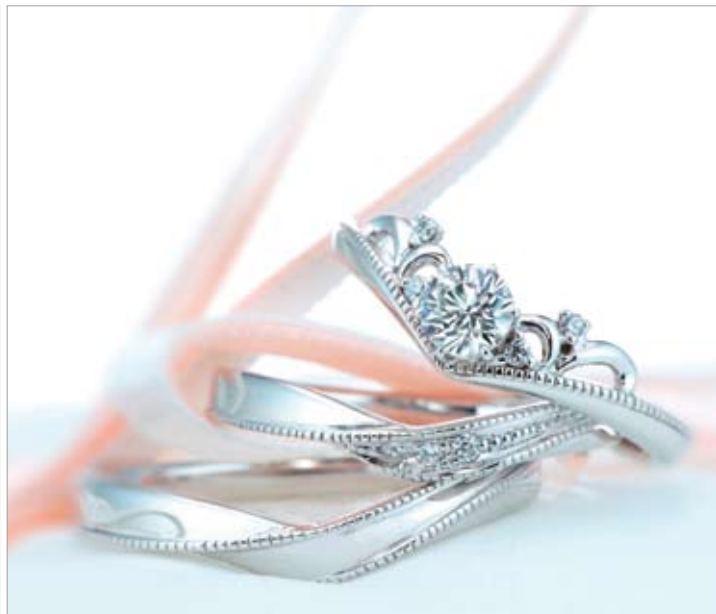
「ディアレスト」。エンゲージ&マリッジリング2本の計3本を20万円以下で購入できるおトクなリング。