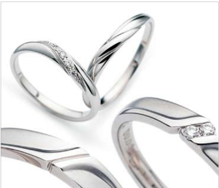
「ランパン」。幸せを願う青色の輝き。昔からカップルたちに愛されるブランドでありながらリーズナブルな価格g網力。