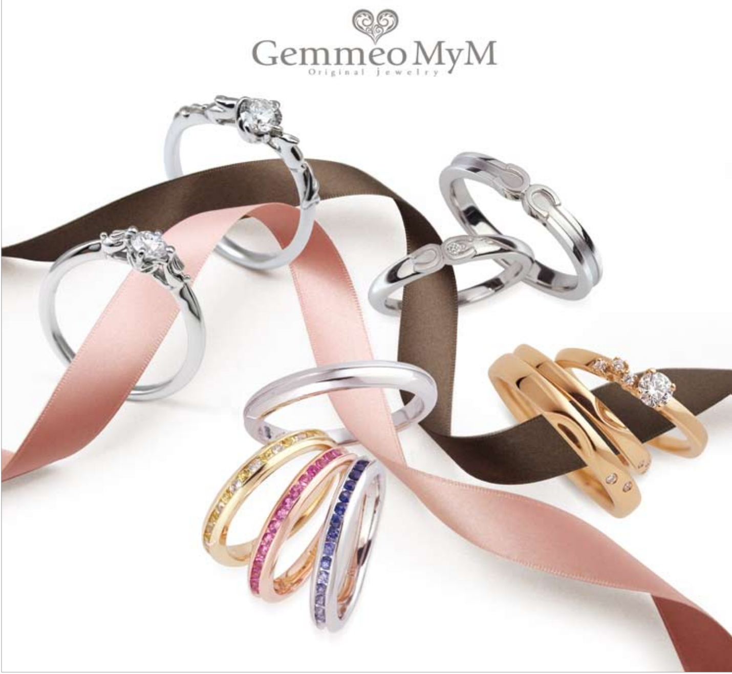
女性の感性を刺激する、ロマンチックなストーリーが込められた新コレクション「ラブ・ストーリー」。

今まで作ってきたふたりの幸せな思い出をスイートに表現し、これらから始まるふたりの物語をあでやかに築いて欲しいという願いが込められた、ジエンメオミイムオリジナルマリッジリング「Love Story」。幸せになるためのアイテムをモチーフにしたマリッジリングには、同店のコンセプトでもある、幸せを運ぶウサギも登場。今までにない斬新なデザインで、カラーバリエーション豊富なストーンも多彩にそろえている。また、マリッジリングには、誕生石をセッティング可能。ふたりだけのリングを作ってみよう。 「Love Story」が展開する3シリーズは、どれもロマンチックな物語が込められた特別なリング。ふたりを祝福する場で愛飲され、グラスでキラキラ浮かび上がる泡をダイヤモンドに見立てた「シャンパン」、祝いのシーンで愛され続けるスイーツ「マカロン」、ロミオとジュリエットに登場する白馬をイメージした「馬蹄」。なかでも、「シャンパン」は、このリングのためだけに作られた、シャンパンカラーで、女性の指が華やかに輝くと好評だ。購入後のカスタムやアフターケアなど、充実したサービスにも注目したい。