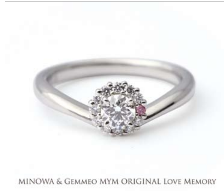
「ラブメモリー」。センターの大きなダイヤモンドを囲むようにメレダイヤをセッティング。ワンポイントでピンクダイヤモンドが置かれ、まばゆい輝きにスイートな雰囲気を感じさせる。