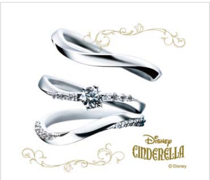
「ディズニーシンデレラ」。シンデレラの名の通り、ロマンチックなストーリーを込めたデザインに、さりげなくあしらわれたメレダイヤがキュート。指を美しく輝かせてくれる。