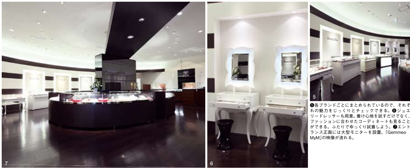
● 各ブランドごとにまとめられているので、それぞれの魅力をじっくりとチェックできる。● ジュエリードレッサーも用意。着け心地を試すだけでなく、ファッションに合わせたコーディネートも見ることが出来る。ふたりでゆっくり試着しよう。● エントランス正面には大型モニターを設置。「Gemmeo MYM」の映像が流れる。